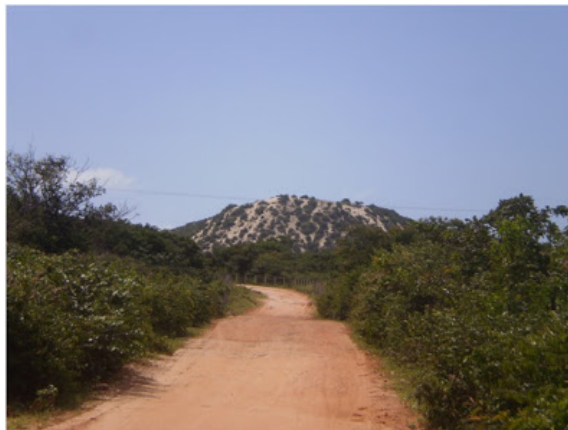
Estrada que liga a CE – 453 a Aldeia Indígena Jenipapo – Kanindé

Por Bárbara Costa, de Pindoretama – CE Jenipapo-Kanindé é uma das etnias