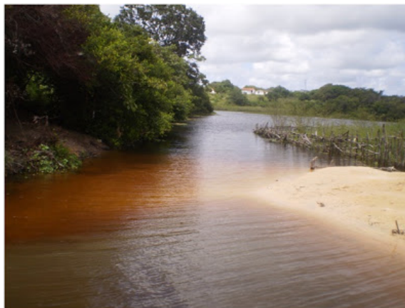
Lagoa Encantada – Próxima ao Morro do Urubu