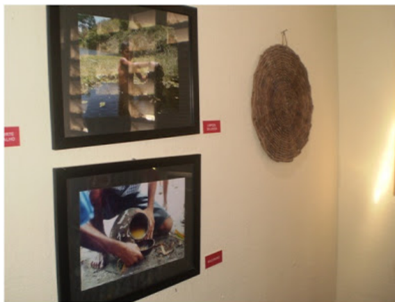
Área Interna do Museu dos Jenipapo-Kanindé