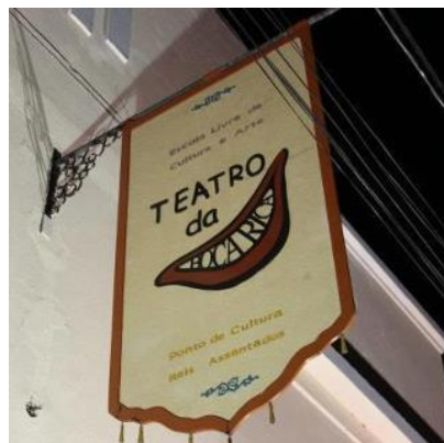
Placa externa do Teatro da Boca Rica. Criação de Marcelo Santiago