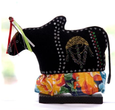
Boi de Mestre Pedro Boca Rica, criação do artesão Chico Batista 1 .