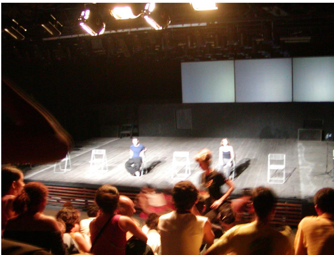
BIENAL INTERNACIONAL DE DANÇA DO CEARÁ (PARCEIRA)