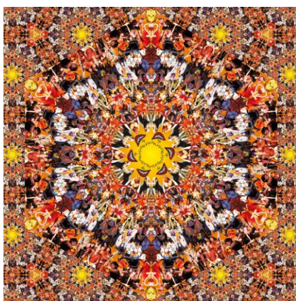
Mandala do teto Teatro da Boca Rica. Criação de Zé Tarcísio