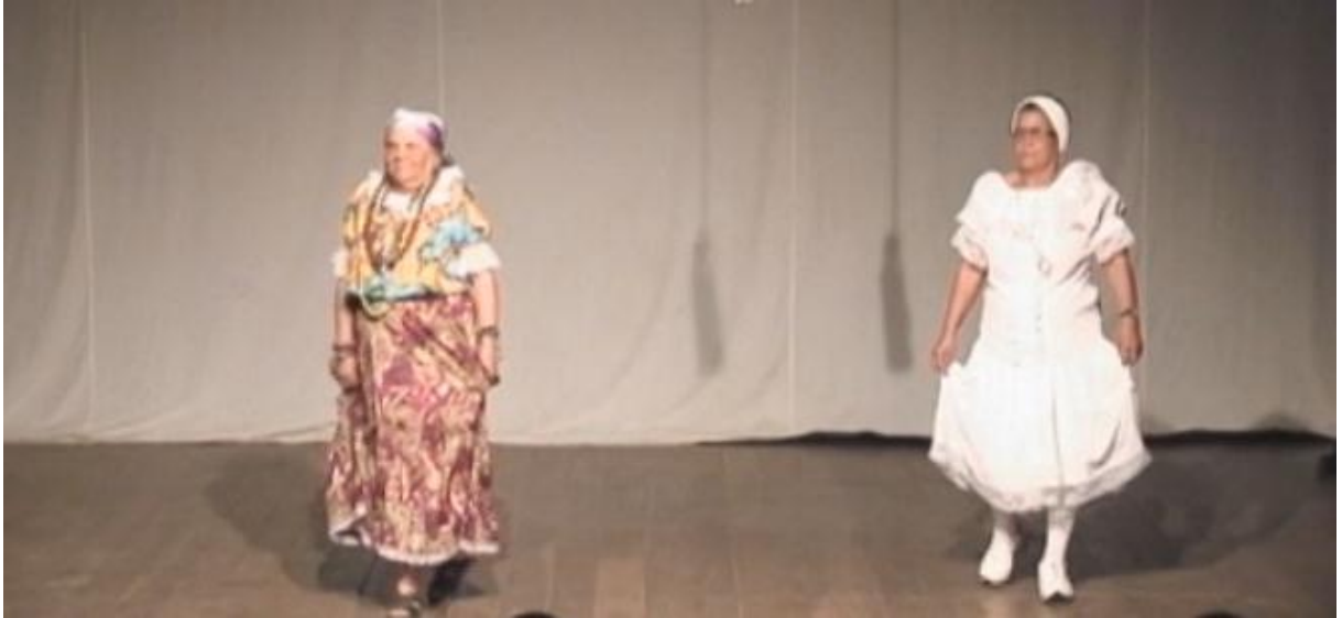
Fig. 43. Grupo Tradição na representação do bailado A Cigana e a Baiana .