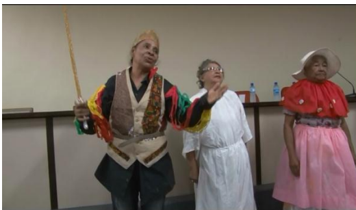
Fig. 6. Grupo Tradição na performance do drama O Príncipe e a Camponesa .

Este drama foi documentado por mim e pelo cinegrafista Marcos Cortez no Auditório Prof. Aloísio Cavalcante da Universidade Estadual do Ceará - UECE, por ocasião do “Seminário Política e Acesso à Literatura e ao Livro Enquanto Direito Humano”, realizado no dia 9 de fevereiro de 2012. Não há presença da dança.