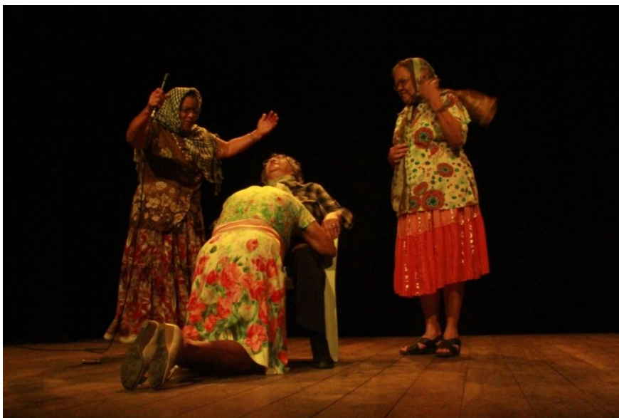
Fig. 16. Grupo Tradição na performance do drama Jorge e Juliana .

Os comentários ao longo do texto são realizados por mim para explicar a cena.