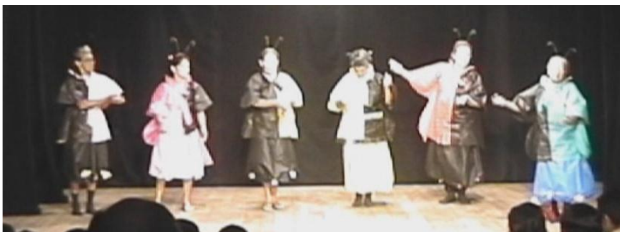
Fig. 39. Grupo de Dramas de Pernambuco na representação de As Borboletas .

Em As Borboletas , seis dramistas vestem-se como com roupas coloridas de preto e outra cor como rosa, encarnado (vermelho) e amarelo. A fábula está distribuída em três pequenas melodias, sendo a primeira em ritmo de marcha binária (pastoril) e as duas seguintes em valsa com metro ternário.