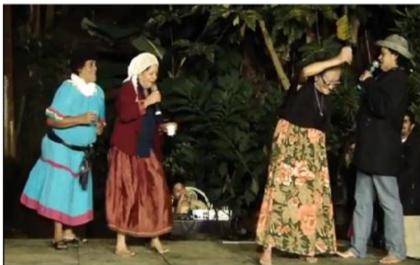
Fig. 32. Grupo Raízes na performance de As Bêbadas .

A melodia que apoia o bailado em As Bêbadas é executada em ritmo de baião que é dançado pelas dramistas de pés descalços. Os versos e as rimas são livres. Diferentemente da versão documentada por Barroso no Litoral Leste e pelo informante Rômulo Félix em Quixeré, esta apresenta três dramistas representando as esposas. Daí o título ser grafado no plural. Este bailado foi documentado pela Escola de Comunicação da Serra - ECOS no dia 21 de maio de 2011, por ocasião da VII Mostra dos Dramas de Guaramiranga, realizada na Comunidade de Nova Fortaleza.