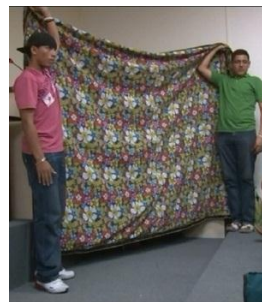
Fig. 7. Empanada improvisada para servir de limite entre o camarim (?) e a caixa de cena.