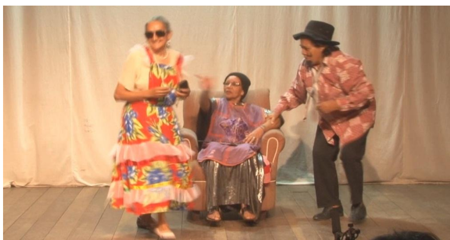
Fig. 51. Grupo Raízes na representação de A Vitalina .

A Vitalina é a história de uma moça solteira que, por mais que se enfeitasse, não conseguia arranjar namorado. Nem os conselhos do padre foram suficientes para a resolução do problema. Seu destino está fadado à solidão do caritô 108 .