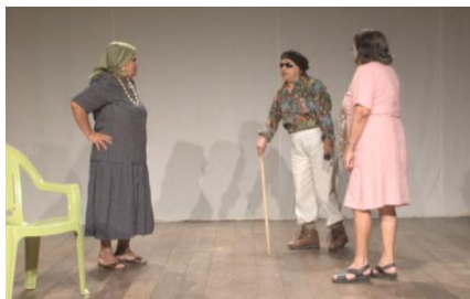
Fig. 23. Grupo Tradição na performance do drama O Ceguinho .

O drama começa quando a mãe entra em cena dizendo-se cansada. Senta-se na cadeira e põe-se a repousar. Em seguida, entra Maria avisando à mãe que vinha chegando um cego pedindo uma esmola.