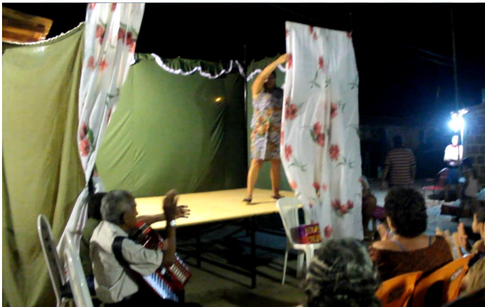
Fig. 2. Modelo de palco em Lagoinha do Quixeré – Ceará. Imagem de Marcos Cortez. Comédia de Dramas encenada na noite de 19/03/2014. Pela escassez de espaço, os tocadores posicionam-se abaixo do palco. O tecido verde-musgo delimita as duas laterais e o fundo do palco; o tecido branco com detalhe de flores coloridas é a empanada.

que de forma improvisada, o modelo do palco italiano, que atualmente é utilizado pela maioria das comunidades onde os dramas ainda são apresentados. Trata-se de um tablado feito de pedaços de madeira formando um quadrilátero ou retângulo. Mede, aproximadamente, uns 12 metros quadrados. As duas paredes laterais e a do fundo do palco são construídas de um mesmo tecido, normalmente liso e de cor escura. Já a empanada ou cortina, varia bastante. Segundo as dramistas de Quixeré com quem o maestro Rômulo Santiago Félix conversou, algumas vezes é feita de tecido escuro. De outras, usa-se de cor branca com detalhes estampados de flores para dar maior destaque e alegria ao ambiente.