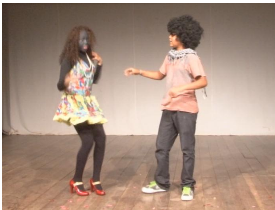
Fig. 26. Grupo de Dramas do Colégio Júlio Holanda na performance do Drama Casal de Nêgo .

Este drama foi registrado por ocasião da VIII Mostra dos Dramas de Guaramiranga – Festival do Riso e da Flor, realizado no Teatro Rachel de Queiroz (o pequeno), no dia 26 de maio de 2012.