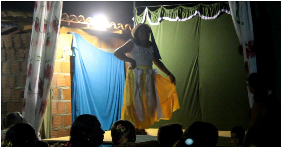
Fig. 3. Vista frontal do modelo de palco utilizado em Lagoinha do Quixeré. Observa-se no fundo do palco a porta de uma casa disfarçada com uma espécie de lençol. É, na realidade, um camarim improvisado onde as dramistas trocam as indumentárias.

Em Lagoinha do Quixeré a quarta parede do palco, a que fica ao fundo e é visível ao público, na realidade esconde a parede de uma casa à qual o palco/palanque fica encostado. A porta da casa fica disfarçada por uma toalha ou lençol. É por ela que as dramistas entram na casa para trocar a indumentária antes da apresentação de uma nova peça.