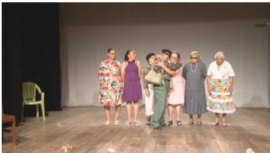
Fig. 50. Grupo Tradição na representação da Comédia Dramática O Soldado .

Esta Comédia de Comoção foi apresentada no dia 26/05/2012, por ocasião da VIII Mostra dos Dramas de Guaramiranga, acontecida no Teatro Rachel de Queiroz (o pequeno).