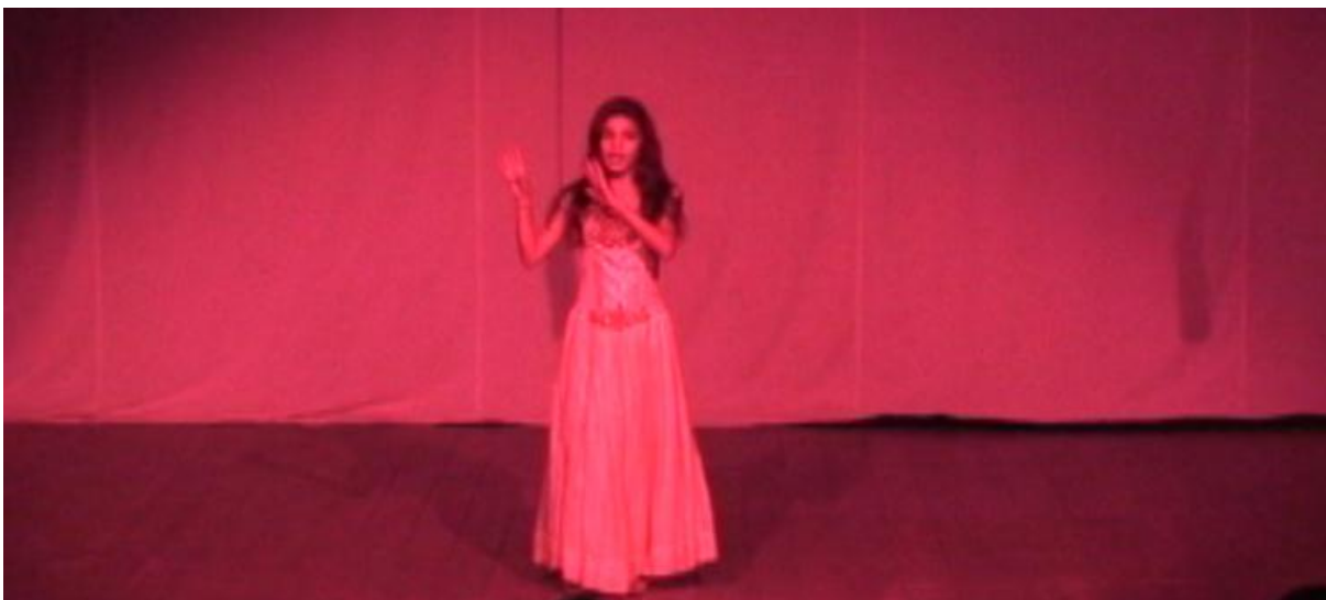
Fig. 37. Grupo de Dramas do Colégio Júlio Holanda na representação do bailado A Linda Menina .