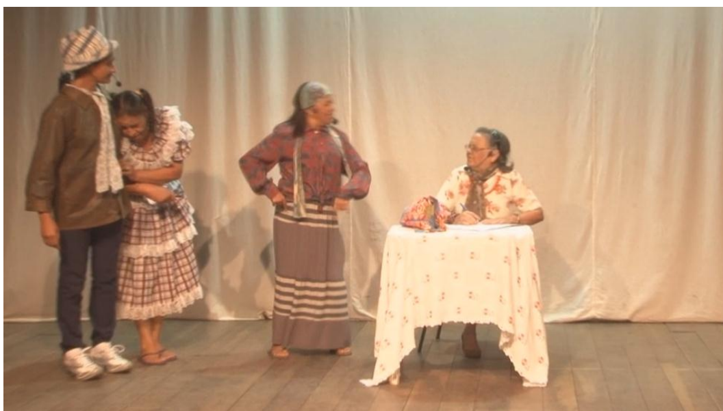
Fig. 45. Grupo Tradição na representação da comédia Catirina .

A cena se inicia com o casal e a filha chegando ao internato onde são recebidos pela diretora em sua sala. Esta, sentada em uma cadeira, à frente de sua mesa de trabalho, ouve pacientemente todo o discurso dos pais de Catirina, somente intervindo na estrofe final do drama. Catirina permanece calada e triste durante toda a cena, limitando-se apenas a ouvir, cabisbaixa, as falas dos demais personagens. Todos saem, permanecendo no palco apenas a diretora e Catirina. É neste momento que final a Diretora (Dona Augusta) muda a postura e assume comportamento despótico, ameaçando Catirina de castigo caso não se comporte bem. Deixa no ar a ideia de que Catirina terá uma vida dura no internato, bem diferente daquilo que seus pais esperavam.