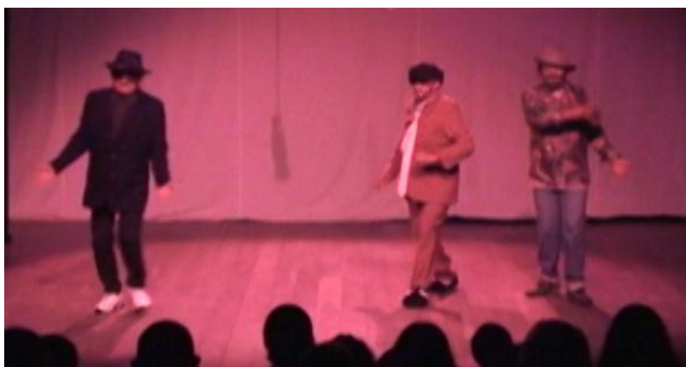
Fig. 35. Grupo raízes na representação do bailado Seu Coió . Imagem da Escola de Comunicação da Serra – ECOS.

Este Bailado foi documentado no dia 21 de maio de 2010 por ocasião da VI Mostra dos Dramas de Guaramiranga. As imagens São da Escola de Comunicação da Serra - ECOS.