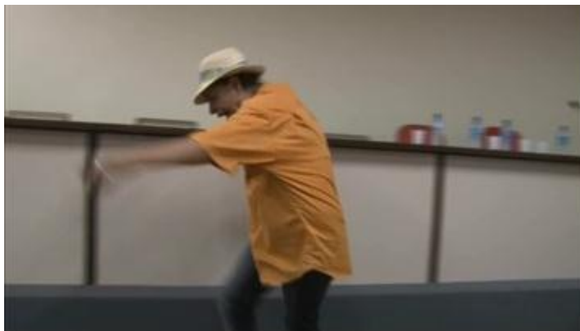
Fig. 47. Grupo Tradição na representação da comédia O Bêbado .

Observa-se pela fotografia que os trajes de Marta não estão compatíveis com a descrição que fiz nos parágrafos anteriores. É que ela acabara de participar de outro drama que deveria encerrar a programação. Mas, diante dos aplausos e insistentes pedidos de bis ela, para não desgostar os presentes, apresentou O Bêbado , que não constava da apresentação, conservando a indumentária do drama anterior.