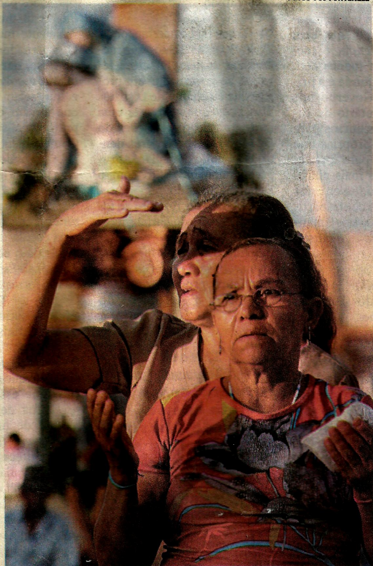
Devotos de padre Cícero e da Mãe das Dores se reúnem em Juazeiro